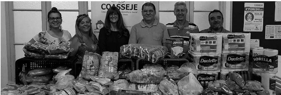
Entrega dos Ingredientes adquiridos com o resultado do Evento "Happy Hour Beneficente".

Evento organizado pelo SINDITEC - Sindicato das Indústrias de Tecelagem de Americana, Nova Odessa, Santa Bárbara D'Oeste e Sumaré – "Happy Hour Beneficente", dia 04 de abril, no Pizza Company, cujo resultado reverteu para aquisição de ingredientes para os Lares Coasseje;